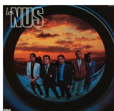
Les Nus 1982 RCA