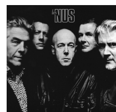
Les Nus 2016 HYP

Les Nus www.facebook.com/lesnusmusique www.lesnus-music.com